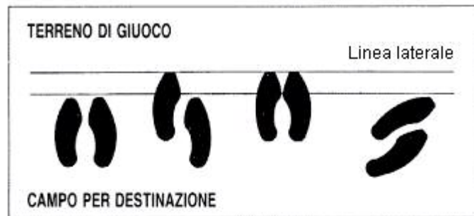
Posizione regolare dei piedi